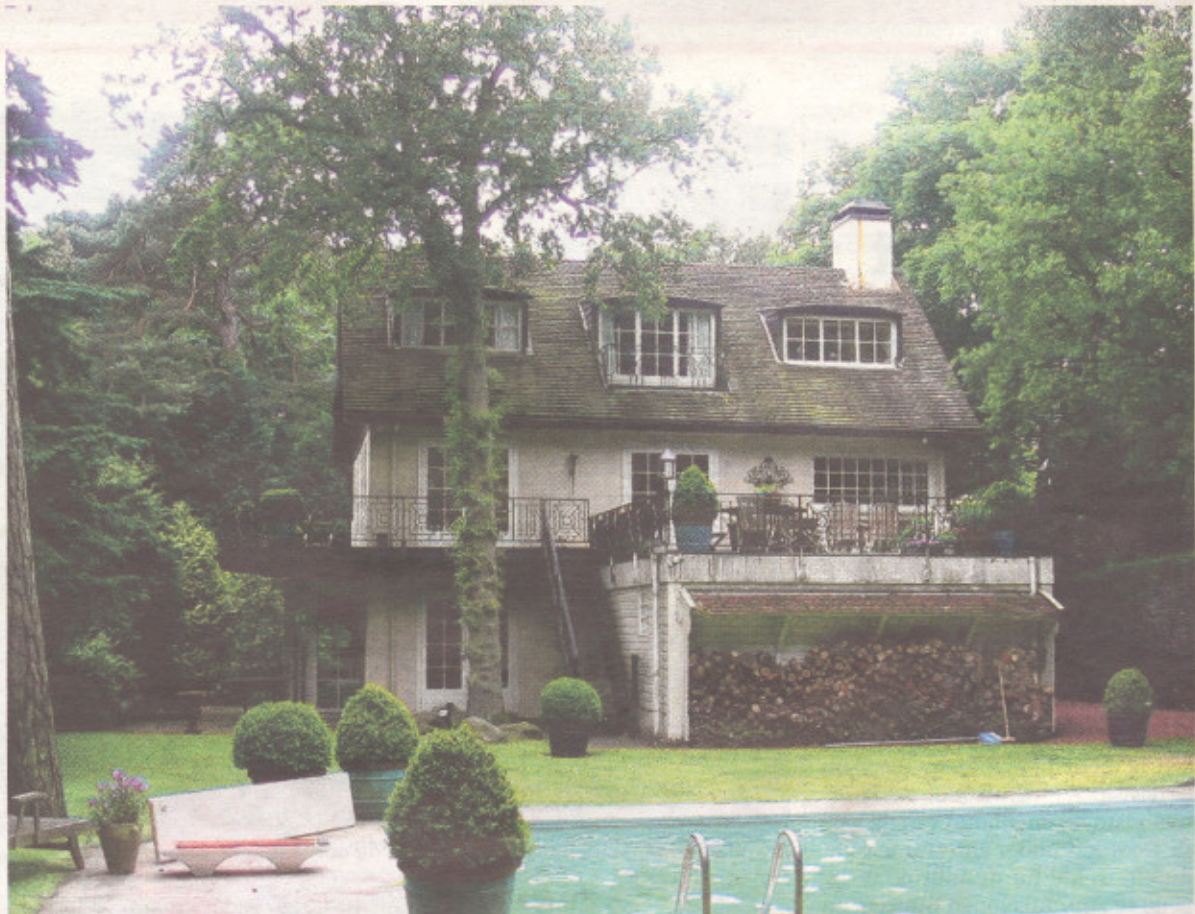
Een woning aan de Van der Oudermeulenlaan - voorzien van een eigen oprijlaan en een zwembad - is een van de vele kapitale panden in Wassenaar die te koop staan.

De argeloze passant aan de Schouwweg heeft er geen idee van dat er achter de gevels financiële zorgen leven. En die zouden wel